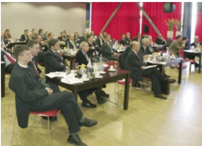
Algemene ledenvergadering VEBON, januari 2005

VEBON is samen met de verenigingen VPB, Uneto-Vni (vakgroep Beveiliging), VEB en NHI lid van het platform VvBO, het Verbond van Beveiligingsorganisaties. VvBO is eind 2003 opgericht met als doel de krachten te bundelen wat betreft onderwerpen als wet- en regelgeving op Europees en nationaal niveau, publiek-private aanpak van de veiligheidsproblematiek en de profilering van de sector als geheel.